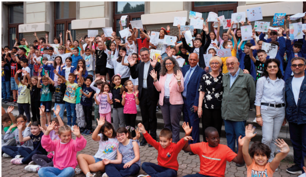
Il vescovo Trevisi, con le autorità della città di Trieste e i bambini della scuola "Duca d'Aosta", alla festa della premiazione del concorso transnazionale "Lotta al Tabagismo" di ANVOLT

Il cortile della scuola elementare "Duca D'Aosta" di Trieste era quasi stretto per gli studenti che lo affollavano come piccoli artisti, mostravano i loro disegni al vescovo Monsignor Enrico Trevisi. Sua eccellenza si trovava lì per premiare i vincitori dell'edizione nazionale del Concorso Internazionale di ANVOLT "Lotta al Tabagismo". Naturalmente la sua figura non è passata inosservata, ci si sarebbe aspettati un uomo austero, invece si è dimostrato accogliente, come un maestro. Pazientemente ha risposto a ogni sorta di domanda che gli è stata fatta e lui, essendo come loro emozionato, ha risposto a tutti. Ha consigliato e stretto mani, regalando